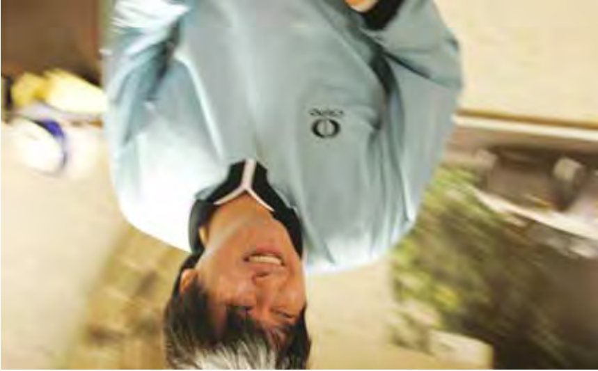
Les Acteurs et Les Personnages