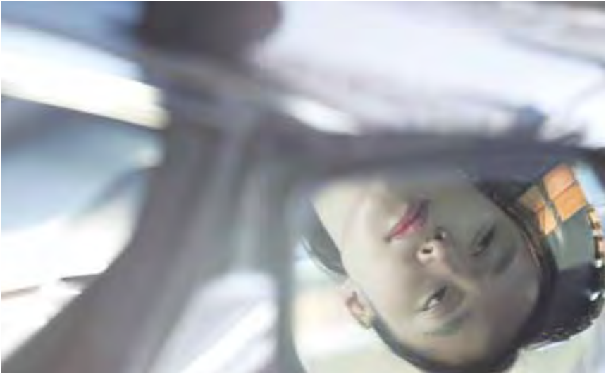
Les Acteurs et Les Personnages