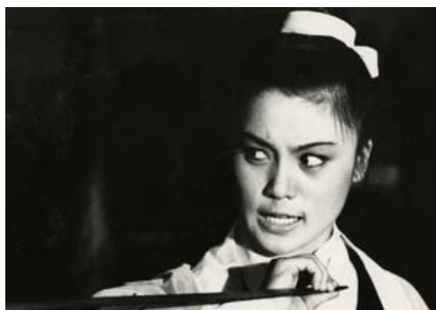
SHANG KUAN Ling-Feng

Shang Kuan Ling-feng, également connue comme Polly Kuan, entre sur concours dans la société taïwanaise Union Film Company en 1966. En 1967, elle joue dans L'Auberge du Dragon , et le succès de ce film a rendu l'actrice célèbre. Elle devient, avec Xu Feng, les actrices de premier rang du cinéma wuxia au sein de Union Film. En plus de jouer dans les films d'épée, elle pratique assidûment les arts martiaux dans la vie réelle, et atteint le 2 e dan (grade) en taekwondo et en karate. Sa prestation dans Backalley Princess de Lo Wei (1973) lui permet de remporter le Prix d'interprétation féminine au 11 e Golden Horse Awards. En 1975 - 1978, elle est au sommet de sa carrière de cinéma, et la série de films The 18 Bronzemen , réalisée par Joseph Kuo, est extrêmement populaire. Puis elle part étudier la communication de masse aux États-Unis. Après son retour à Taïwan, elle joue dans des films comme Heroine of Tribulation , et s'initie à la télévision. Elle termine sa carrière d'actrice en 1981. Actuellement, elle est professeur de taekwondo aux USA.